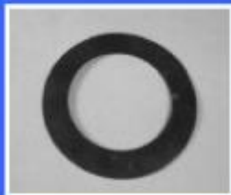
USZCZELKA MISKI SPL.