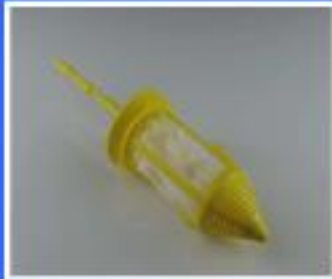
FILTR DURR BEZ OSŁONY