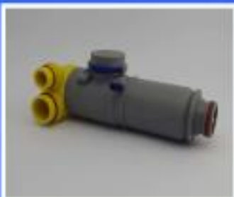
FILTR DURR KOMPLETNY