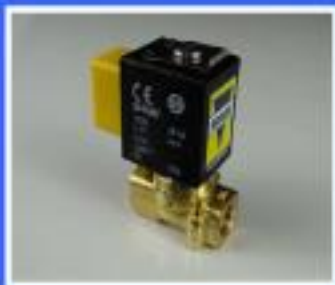
ZAWÓR SIRAI ZB10A 5,5W