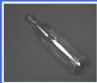
BUTELKA NA WODĘ DEST.