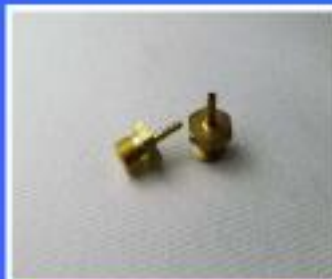
NAKRETKA 4 X 1/8