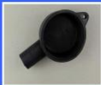
UCHWYT MISKI GUMOWY