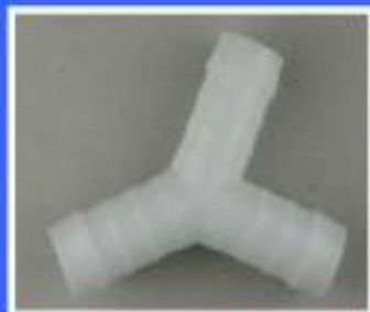
YRÓJNIK YS 19