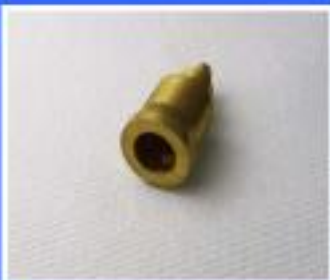
KORPUS RURKI NAP. KUBKA