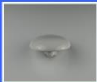
POKRYWKA SITKA SPLUWACZKI