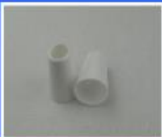
OSŁONA RURKI NAP. / OPL.