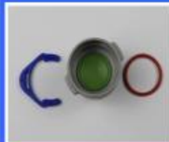
ZAWÓR SPLUWACZKI DURR