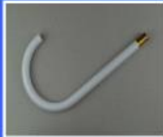
RURKA NAPEŁNIANIA KUBKA