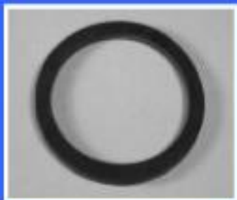
USZCZELKA MISKI SPL.