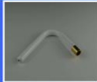
RURKA OPŁUKIWANIA MISKI