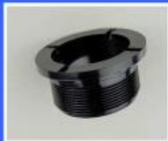
GWINT MOCUJĄCY MISKĘ