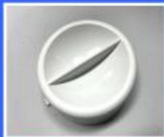
OSŁONA DOLNA FILTRA OLEJU