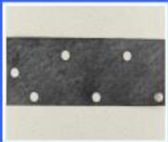
USZCZELKA 4N 8,2x3,1