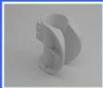
UCHWYT MM P2ED 460