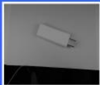
ELEMENT DOLNY WYSIĘNIKA