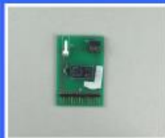
MODUŁ :SIOE 5: