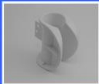
UCHWYT AMDENT / LM