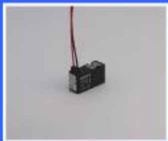
ZAWÓR PNEUMAX 24 VDC 1,3 W