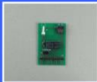
MODUŁ :SIous :