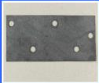
USZCZELKA 5N 7,4x3,4 cm