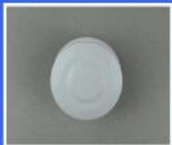
KÓŁKO WYSIĘNIKA REKAWA