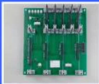
MODUŁ :SDB :