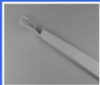
RAMIĘ GÓRNE WYSIĘNIKA