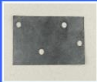
USZCZELKA 4N 5,6x3,4