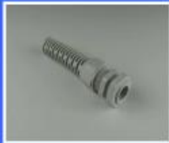
KORPUS RĘKAWA Z NAKRĘTKĄ