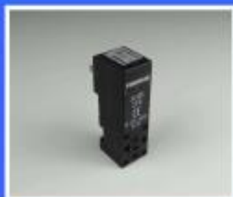
ZAWÓR PNEUMAX 24V DC 2,3 W