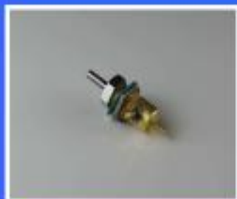
ZAWÓR REGULACJI WODY