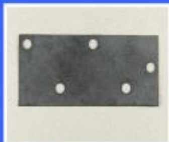
USZCZELKA 5N 6,4x3,1 cm