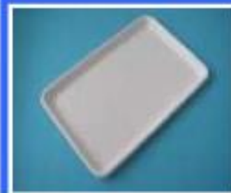
TACKA TRAYSTOLIKA 236 X 360