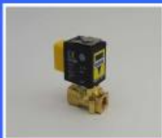
ZAWÓR SIRAI 24V 5,5W