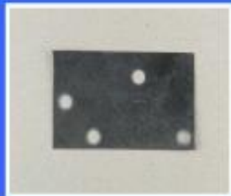
USZCZELKA 4N 5,0x3,1