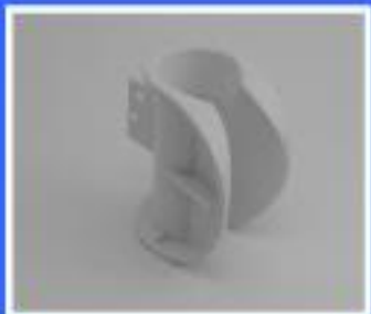
UCHWYT LAMPY MECTRON