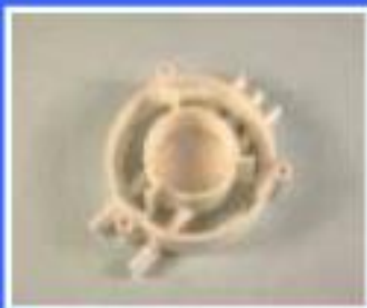
OSŁONA GÓRNA FILTRA OLEJU