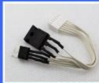
TRANZYSTOR TIP 142