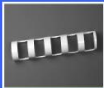
UCHWYT NARZĘDZI 5N