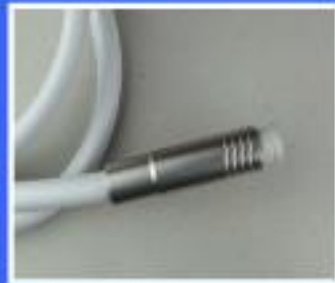
RĘKAW TG UNIWERSALNY